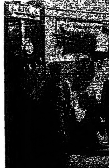
مجموعة من رجال الامن ترصد نشاط القاصية في بيروت